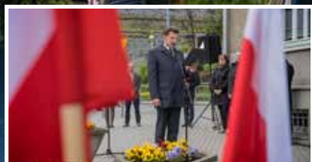
78. rocznica zakończenia II wś - s.2