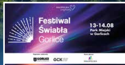
Zbliża się Festiwal Światła - s. 16