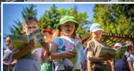
Dzień Dziecka - s.8